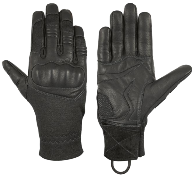
TARA Short Black